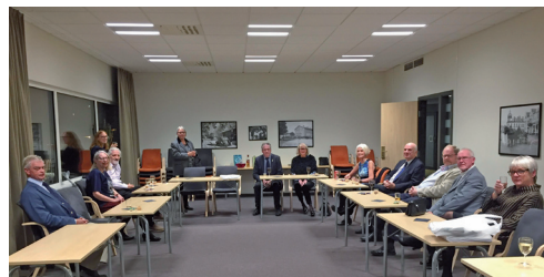
Jag har deltagit i ER-möte i Ljungby i oktober 2020.