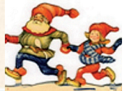
Tomtarnas grötkalas av Aina Stenberg