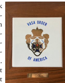
Eastern Vasa Youth Tour 1985, ett minne från ungdomsklubbens besök i Uppsala.

Den 26 oktober fick jag mail från en anhörig till en sedan länge avliden medlem. En vindsgallring hade genomförts i Sollentuna. Där hade hon hittat en regalia med ett vasaemblem och en cylinderhatt i en fin hattask. Även denna förfrågan skickade jag vidare till DL 19.