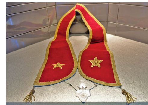
Fynd från en vindsgallring i Sollentuna. Kan vara en DD-regalia.

Den 15 november kom en förfrågan om att bli medlem. Den skickade jag vidare till en närliggande loge i vårt distrikt och önskade lycka till.