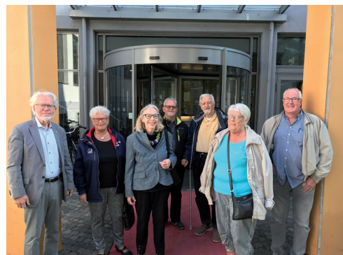
Nomineringskommittén hade möte i Växjö. Här på bilden ses de med sina respektive.