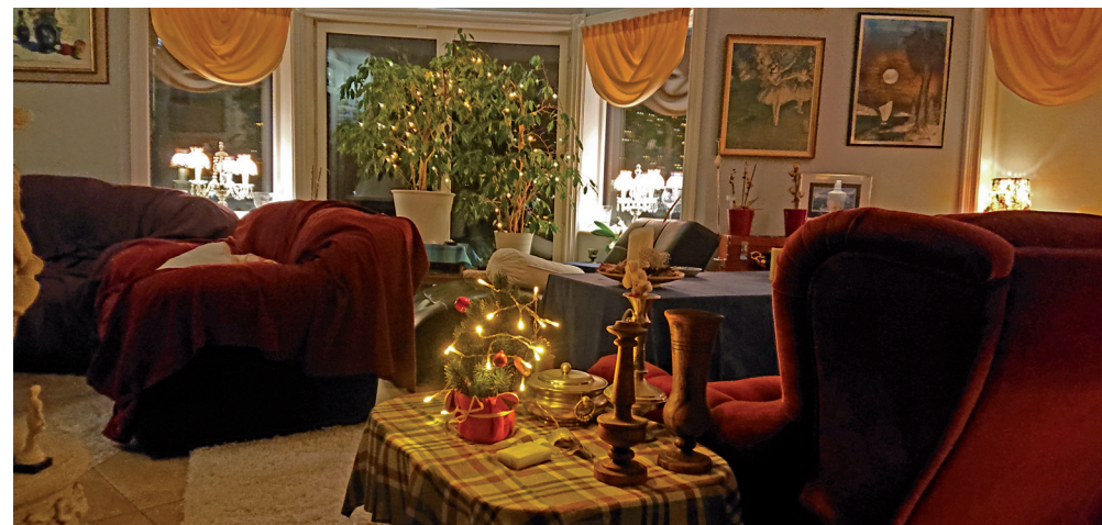
Julpyntning med belysning inleddes den 15 november.