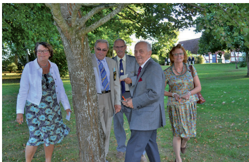
Tipsrunda i parken vid Kverrestads Bydegård när det är kräftfiskiva som efterkapitel