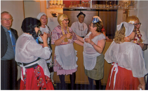
Det blev ett jubel då systrarna dansade in utklädda.