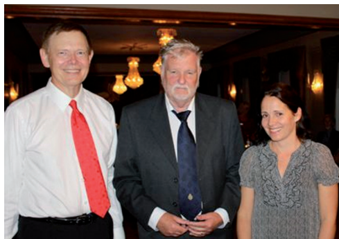
Ordf. och underhållarna.