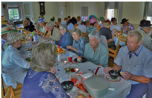
Ett av borden vid kräft/rökafion