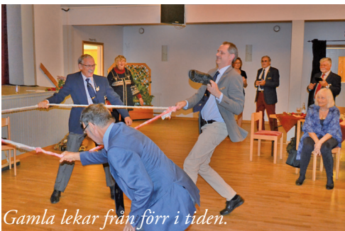
Gamla lekar från förr i tiden.