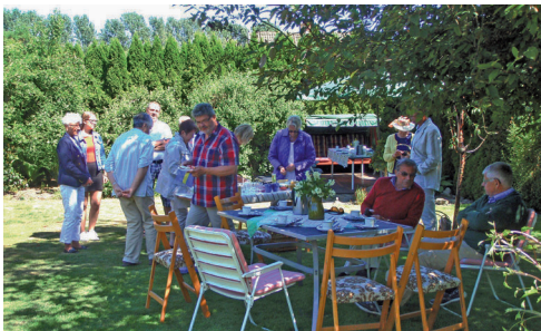
Efter samkväm i trädgården hemma hos paret Åstradsson