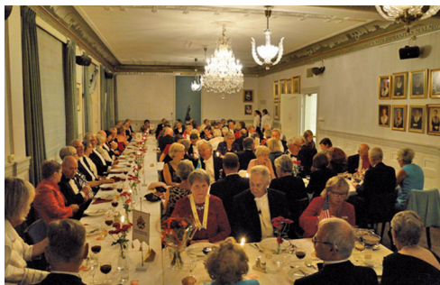
Bankettsalen var välfylld.