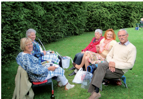
Picknick i parken före teaterframträdandet på Fredriksdalsteatern

Septembarmöte hos Vasa Logen nr 631 i Tomelilla Efter en fantastisk sommar, åtminstone på Österlen, så var det tid att träffas igen för Tomelilla-Logen. Sedan några år tillbaka har det blivit tradition att vi börjar höstens första möte i Bygdegården i Kverrestad.