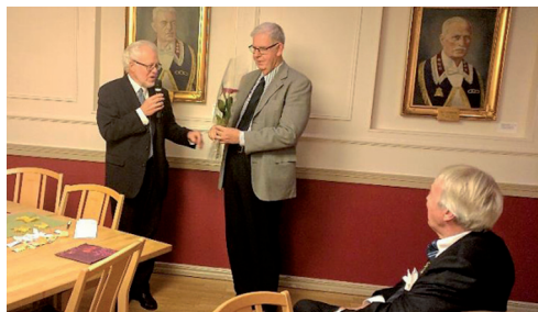
Ordf. br Göte tackade och överlämnade en blomma. .

insignierna som bevis på att hon utsetts till hedersmedlem i vår loge.