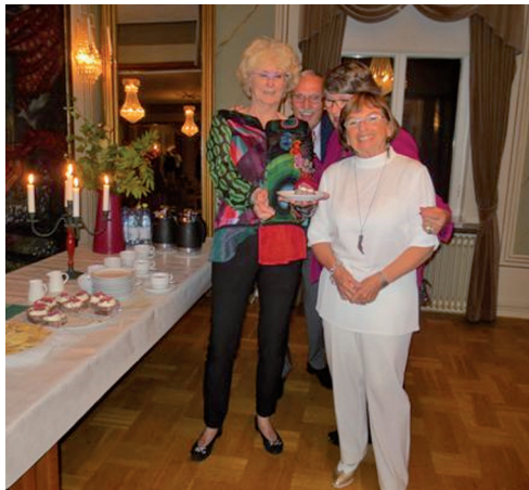
Glada systrar och broder.