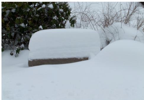
Minns ni de snöiga vintrarna?