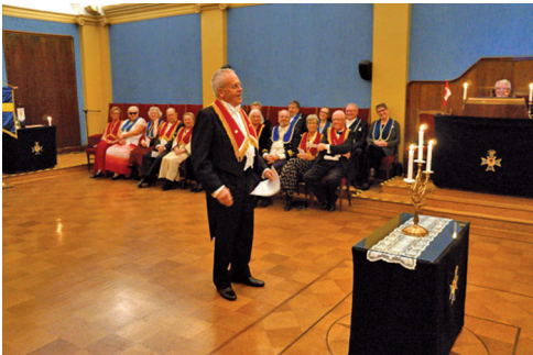
HM Sy Birgit mottar en julblomma.