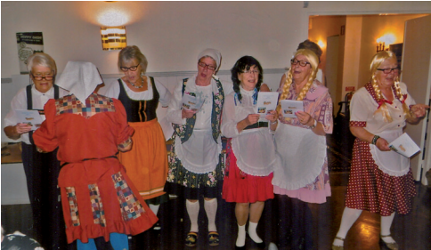
"Trink, trink, Brüderlein trink!"

Efter mötet bjöds på drink i baren och det blev ett jubel då systrarna dansade in utklädda inför systrarnas oktoberfest. Till härlig Humba-Humba dansade alla in i matsa-