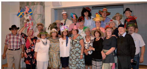
Alla som bar huvudbonader samlade