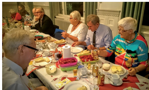
Glada logesyskon med allt som behövs för en kräftskiva