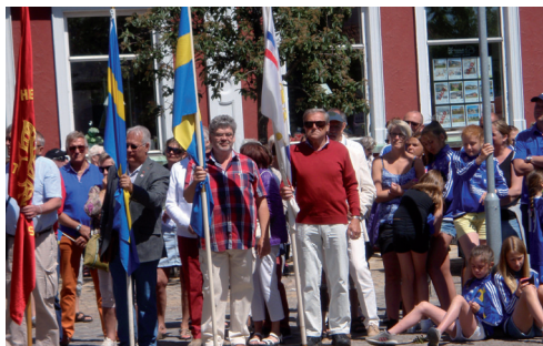
På nationaldagen, vid uppställning på torget Tomelilla