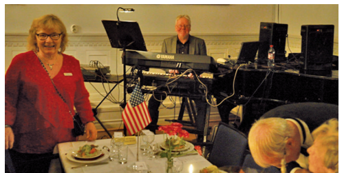
Hasse Skoglund's orkester stod för musikunderhållningen. fortsättning på nästa sida