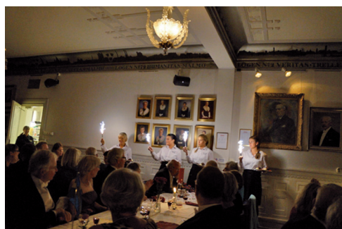
Glassbomben aviserades med stämmingsfullt fyrverkeri.