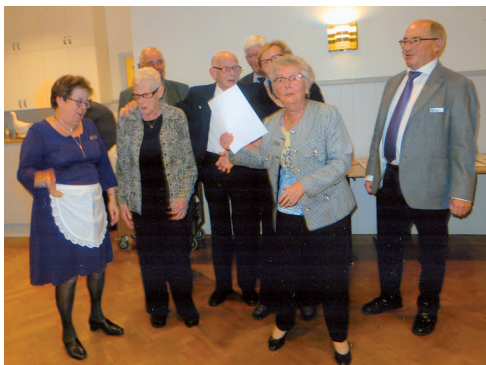
LL608 Sånggrupp 1