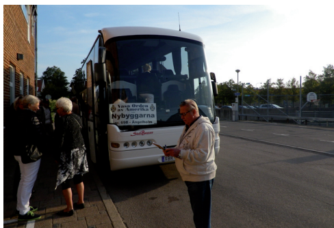
Br Jan räknar in deltagarna.

Ett antal inbjudna gäster, 14 personer (blivande vasamedlemmar?) 25 egna logesyskon, 5 logesyskon från logen 634 Höganäs, sammanlagt 44 personer åkte med på resan. Under bussturen såldes det lotter, och som vanligt hade de en strykande åtgång.