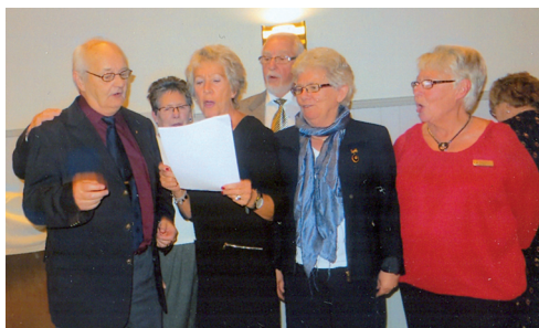
LL608 Sånggrupp 2