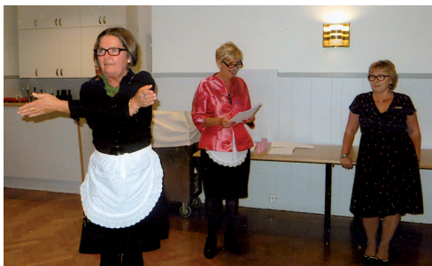
LL608 Byt plats på Systrarnas afton.