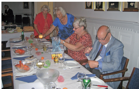
DD-paret packar upp räkör.