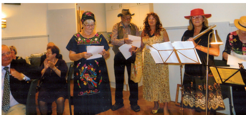
LL608 Musik och sång