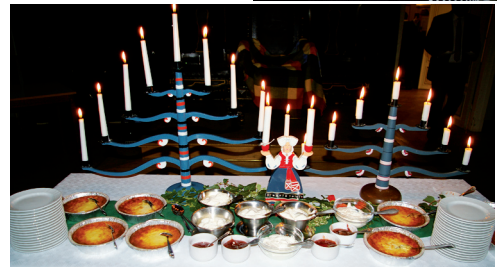
LL678 Bord med ljusstakar från Skatelöv