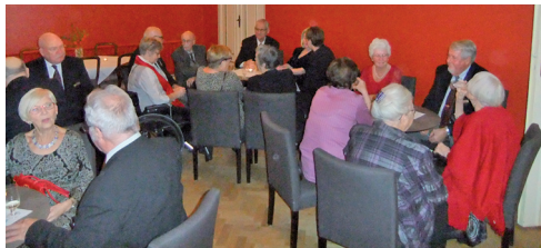
Samling inför logemötet

Bo sjömansvisor på blekingska till eget gitarrackompanjemang. Till sist delades vinsterna ut på lotteriet med mycket större spridning än förra gången.