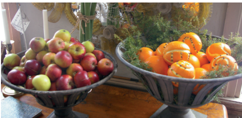
Fruktskålar från herrgården