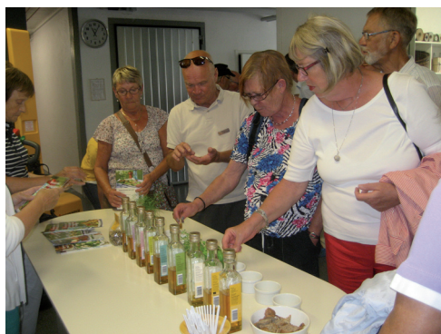
Provsmakning av rapsolja.

Vidare gick färden genom det fagra Österlen som visade sig från sin allra bästa sida denna lördagsförmiddag. Ett stopp vid Simrislunds rastplats där picknickkorgarna dukades fram. Här kunde Logesyskonen beundra den vackra utsikten via de böljande rapsfälten ut över Östersjön.