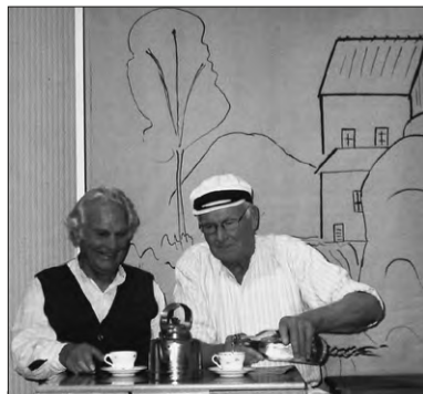
Tackar som bjuder!