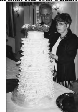
Koncentration. "Spiddekagan" skall skäras