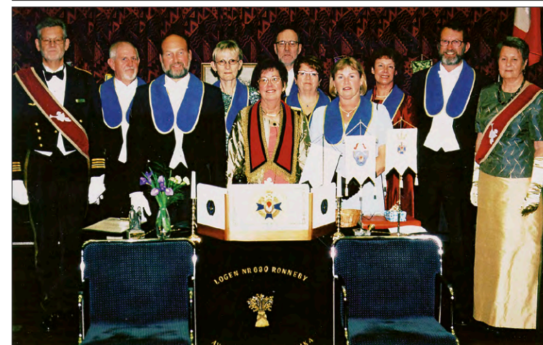
EN BILD FRÅN LOGEN RONNEBYS JUBILEUM DEN 24 MAJ 2003

c/o: Gunnar Mossberg, Tibastvägen 12, 372 53 Kallinge, Tel. 0457-203 90