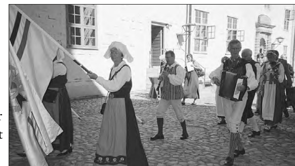
Marsch från slottet med fanorna i täten.