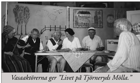
Vasaaktörerna ger "Livet på Tjörneryds Mölla."