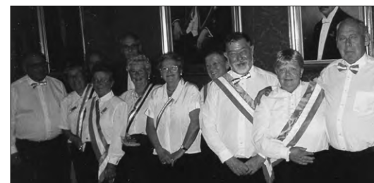
Den "Italienska Kommittén."