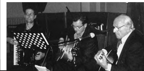
Babbo Italianos underhåll