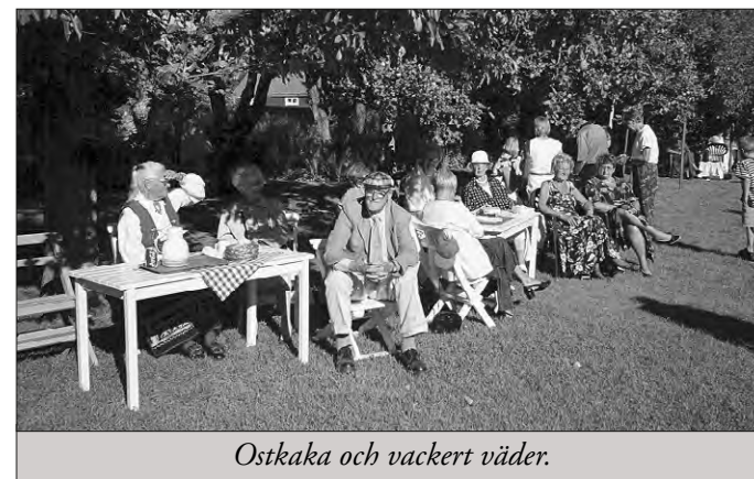
Ostkaka och vackert väder.

Fanparaden genomfördes av Logesystrar som därefter gick i täten till Krusenstiernska Gården. I den vackra trädgården kunde vi njuta av kaffe och traditionell Småländsk ostkaka till välljudande musik.