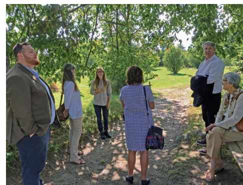
På promenad i Linnés Råshults omväxlande omgivningar.