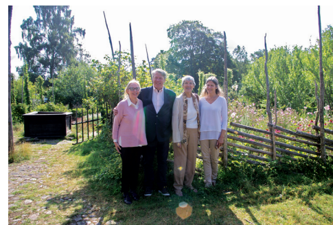
Framför det präktiga trädgårdslandet i Råshult, i bakgrunden syns de höga humlestånden.