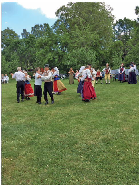
Dansuppväsning i Krusenstiernska gården.