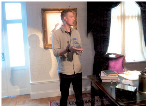
Vår guide presenterar processen från ax till flaska.