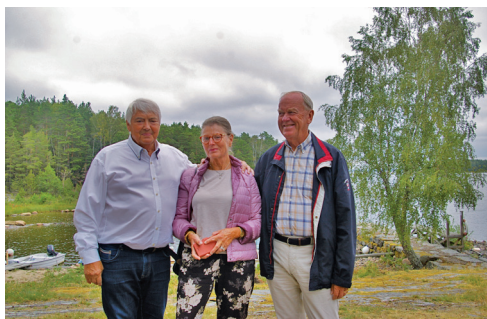
På söndagen gjordes en utflykt till Stenudden, strax utanför Karlstad. Där vi njöt av naturen och en lunch i det fria.