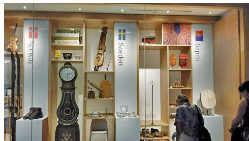
Utställning om Norge Sverige och Sapmi