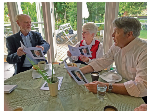
En kaffepaus tillsammans med företrädare för Linnés Råshult.

Utflykten dagen efter blev kontrasternas dag, först historisk tillbakablick med besök på Linnés Råshult och vandring i återskapad 1700-talsmiljö, för att en kvart senare besöka IKEAs Museum i Älmhult och ta del av berättelsen om IKEA i dåtid, nutid och framtid.