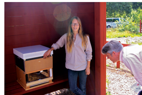
Och visade bikupa med flitiga honungsbin.