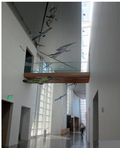
Hallen i Nordiska Museet