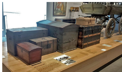
Koffertar och vagn