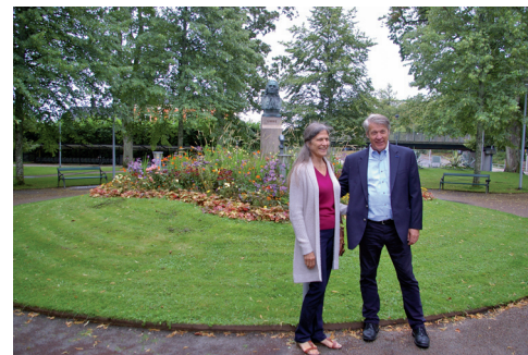
Syster och bror Nelson i Linnéparken.