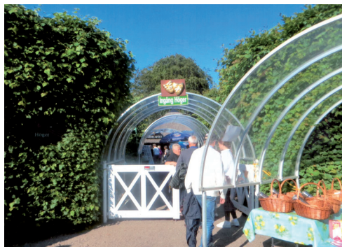
Ingången till den vackra teatern.