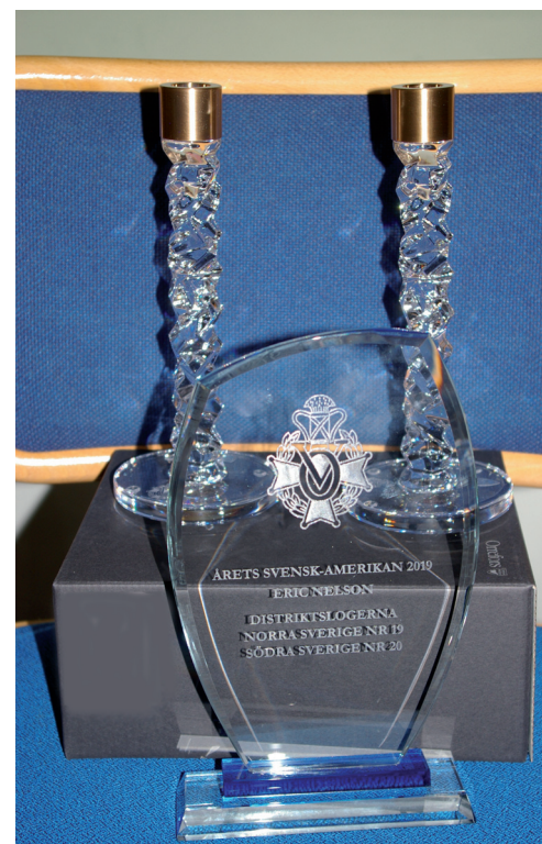
Distriktslogernas gåva i form av ett par Orreforsljusstakar och därframför glasplaketten.