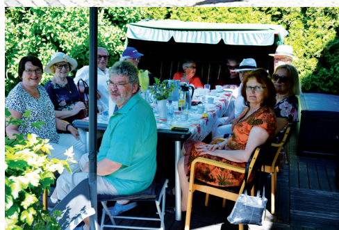
Ett glatt gäng i Åstradssons trädgård.