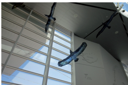
Fågelskulpturer i glas av Tróndur Patursson frá Färöarna