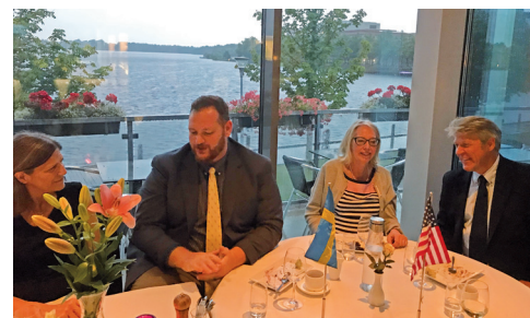
Middag på restaurang 4 krogar.