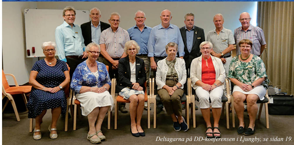
Deltagarna på DD-konferensen i Ljungby, se sidan 19.