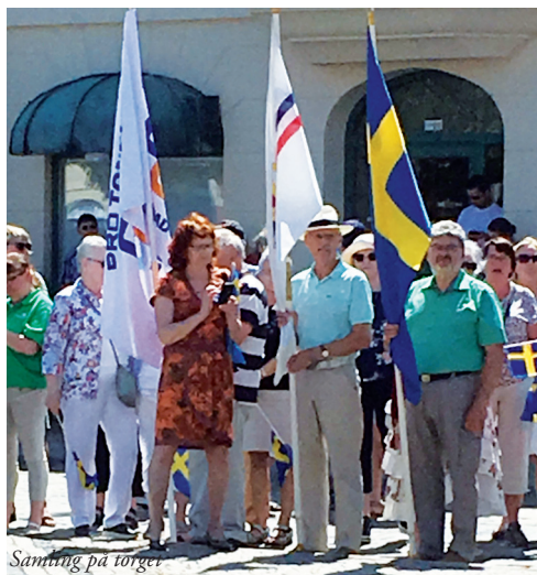
Samling på torget

Nationaldagen firade vi med att marschera från kommunhuset till torget med övriga föreningar och i täten spelade Tomelilla