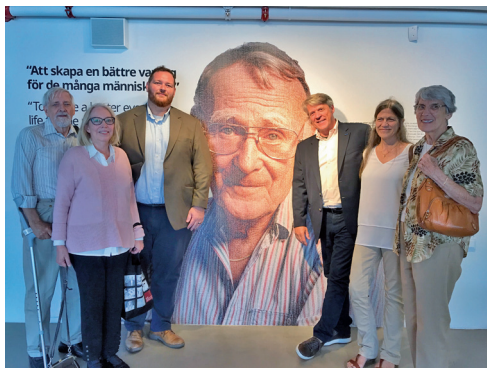
Den ikoniske grundaren av IKEA, Ingvar Kamprad, och den lilla utflyktsgruppen.

Lördagen ägnades åt guidade besök i Växjö Domkyrka och Kulturparken Småland, dels på Utvandrarernas Hus, dels på Sveriges Glasmuseum. Emigrantinstitutets Vänförening bjöd in till middag på restaurang 4 krogar med utsikt över Växjösjön.