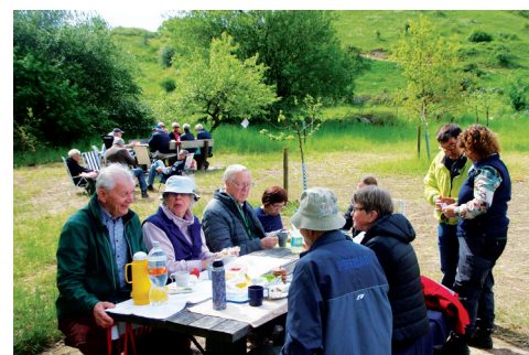
Några bord vid picknicken.