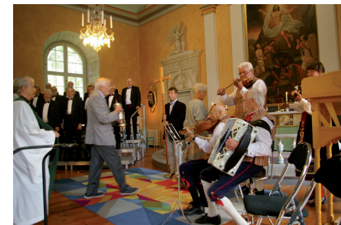
Svensk-amerikansk gudstjänst i Ljuders kyrka.