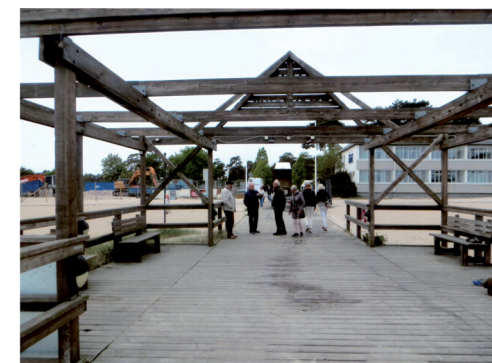
Många ville se den fina bryggan.