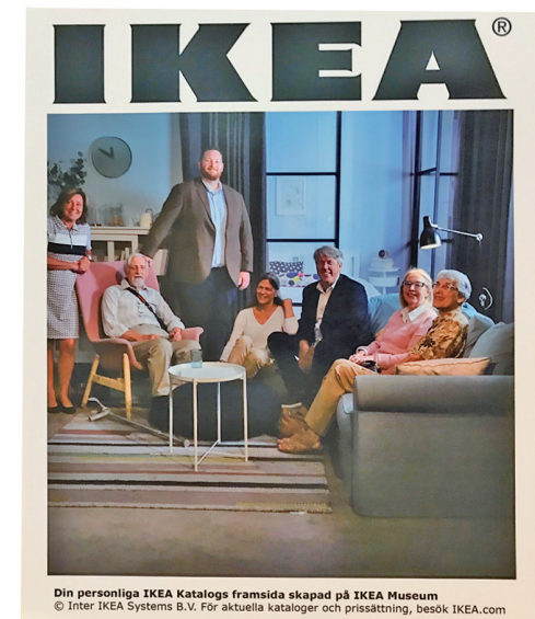
Din personliga IKEA Katalogs framsida skapad på IKEA Museum © Inter IKEA Systems B.V. För aktuella kataloger och prissättning, besök IKEA.com