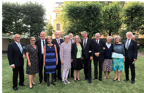
Alla Vasa-syskon från DL Södra Sverige som deltog vid firan- det.

Festkvällen inleddes i Residensets inhä- gade trädgård med välkomstdrink och en strålände dansföreställning av Gundegaba- lettens elever, från barngrupper och uppåt i ålder. Under balettens konstnärliga ledare, Gunta Liede, genomförde olika konstella- tioner av elever ett flertal nummer på olika teman med stor precision, glädje och, inte minst, humor!