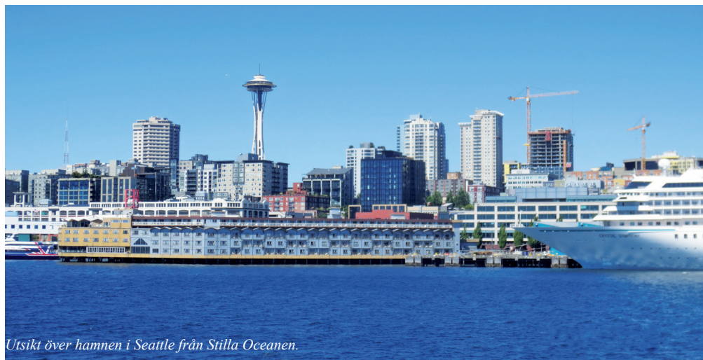
Utsikt över hamnen i Seattle från Stilla Oceanen.