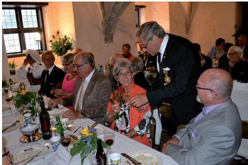
Rosutdelning till de nya medlemmarna.