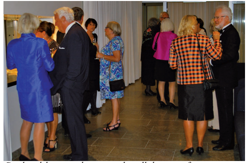
Bankettdeltagarna börjar samlas till den stora festen.