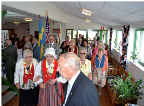
Under intåg till mötet.

fick någon annan styra åt oss, men det var helt ok utan regn.