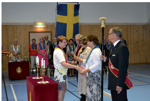
Utdelning av 10-årsmärket.