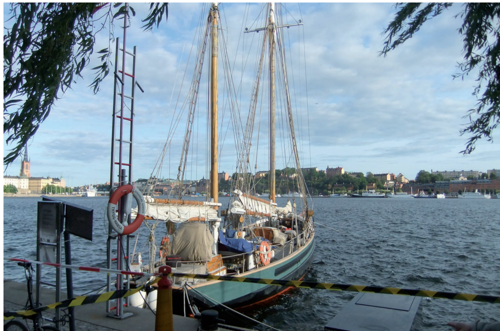
En skuta förtöjd vid Norrmälarstrand med utsikt mot Söder och Kungsholmen.