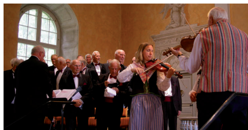
Växjö manskör och Ljuders spelemän underhöll kyrkobesökarna under gudstjänsten.