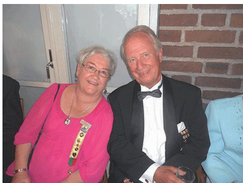
I väntan på logemöte i Logen Höganäs nr 634.