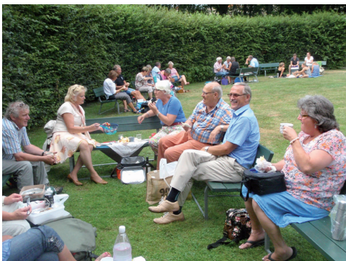
Picknick innan föreställningen på Fredriksdalsteatern.