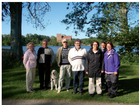
Gökottan där man ser Svaneholms slott i bakgrunden.

Gökottan den 29/5 blev en härlig tur runt Svaneholmsjön med efterföljande picknick.