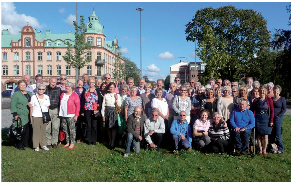
Deltagarna på tjänstemannakonferensen i Ljungby den 2x - 2y augusti 2014.