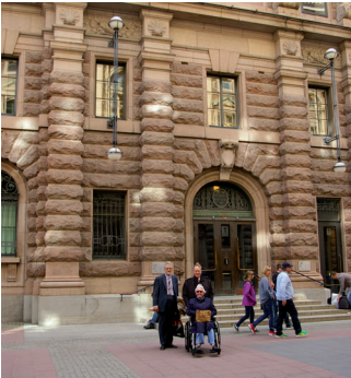
På promenad genom Stockholm, här utanför Riksdagen.