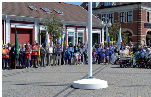
Nationaldagsfrån i Tomelilla.

Gökottan den 29/5 blev en härlig tur runt Svaneholmsjön med efterföljande picknick.