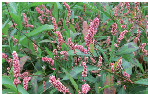
Detalj ur blomsterhavet.