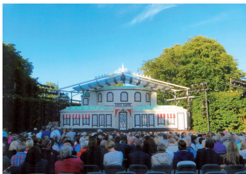
Fredriksdalsteatern i sol den 12 juni 2014.