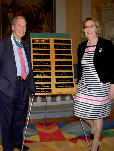
På Minnesotadagen, som numera firas i Ljuders kyrka, avtäckte Årets Svensk-Amerikan tavlan med de ingraverade namnplåtarna.