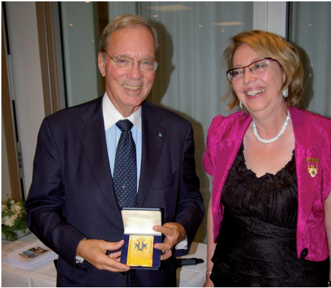
En lycklig Årets Svensk-Amerikan visar upp sin plackett.