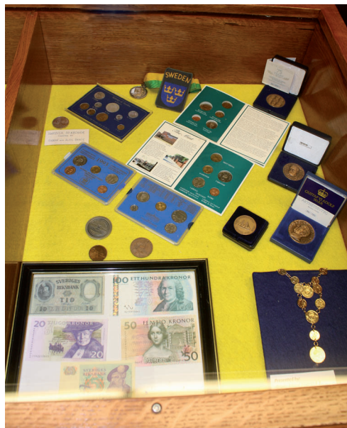
Myntkabinettet på Vasa-Arkivet i Bishop Hill.