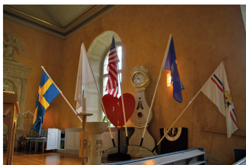
Vasafanorna prydde Ljuders kyrka.