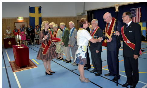
Utdelning av 25-årsmärket.