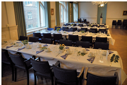
I Matsalen är fint dukad och borden är märkta med olika blad som utgjorde bordsplacering.