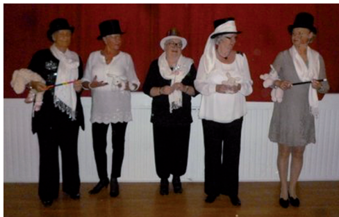
Systrarna bakom kvällens magiska afton