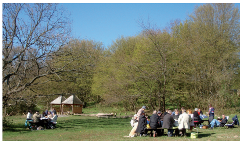
27 st samlade i gröngräset vid Stenshuvud och äter medhavd fika.