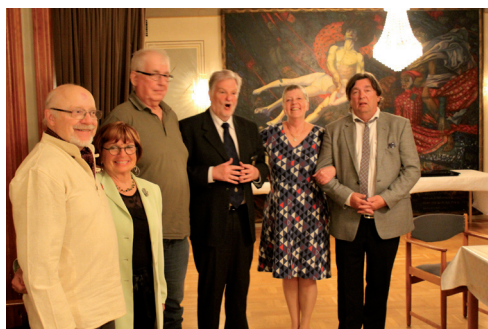
Kommittén som gjort allt så fint och gott och en mysig kväll.