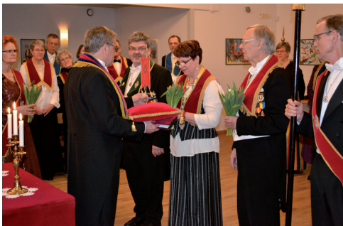
Avtackning med blommor.