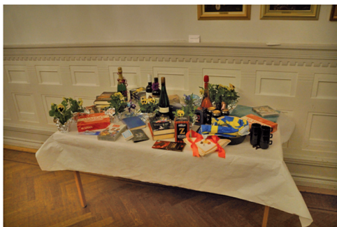
Vinster i lotteriet.