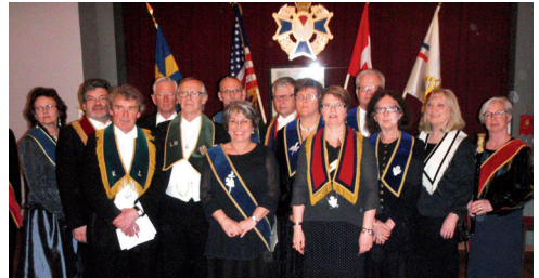
LL631 Tomellilla Logen nr 631 nya styrelse