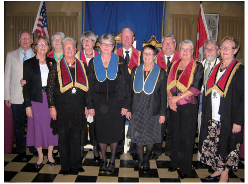
LL749 Gäster på 20-årsjubileet.