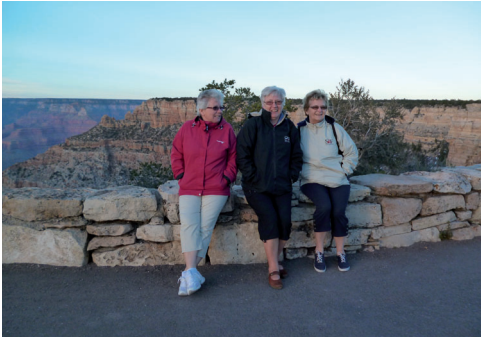
USA-resan: Tre glada systrar i Grand Canyon