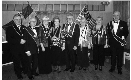
Installationsstaben från LL Klockan nr 747.

Vi tog också emot 2 medlemmar från LL Klockan nr 747 i Örkelljunga som hade flyttat till våra trakter. Nyinstallerade KL berättade om ett besök i Mark Twains Hus i Connecticut tidigare i höst. Efter mötet startade dansen till Gert Reinholds enmansorkester och snart var alla uppe på dansgolvet. Ännu en trevlig Vasa afton var till ända.