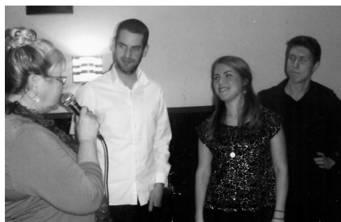
'Band 28A' avtackas.

Efter logemötet samlades vi i vanlig ordning till en välkomstdrink och placerades sedan vid borden med anknytning till musik. Maten hemlagad och menyn var mycket välkomponerad. Vi började med en god paté med tillbehör. Varmrätten var färsk ugnsbakad lax som var mycket läcker. Till kaffet och chokladtårtan lyssnade vi till härlig jazzinspirerad musik av "Band 28A".