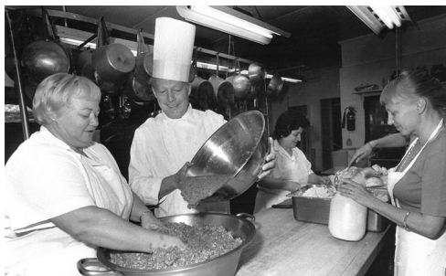
I köket 1985.