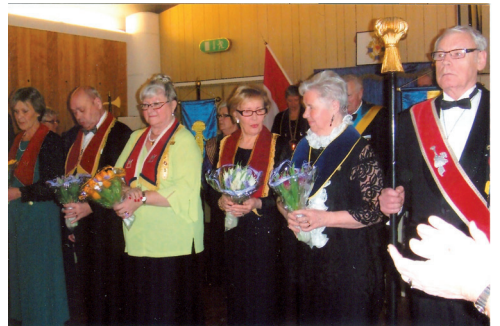
Avgående tjänstemän avtackades för det arbete de lagt ner i logen med en bukkett blommor.