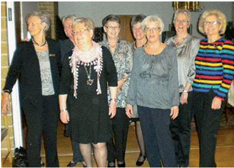
LL634 Systrarnas afton