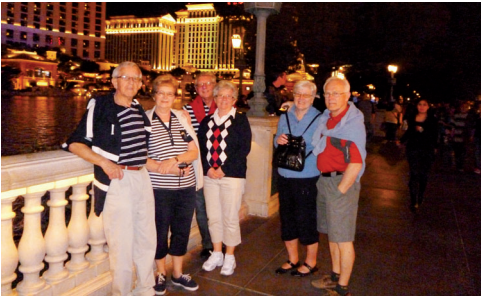
USA-resan: Las Vegas by night