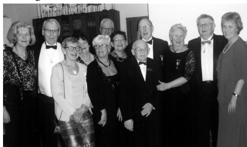
Den förstärkta arbetsgruppen.