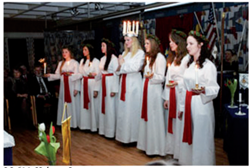
LL628 Kalmar Lucia