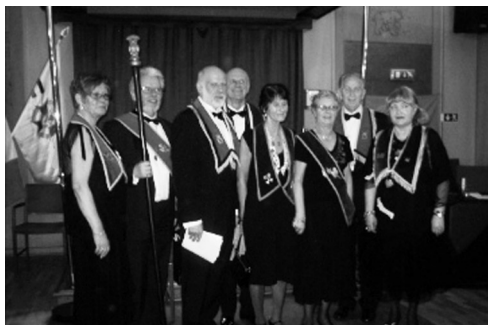
Staben från LL Skåne nr 570.

och Vasa Orden av Amerika. Efter den goda måltiden dansades till Hasse Skoglund's enmansband. Vi midnatt skildes vi åt efter en mycket trevlig Vasakväll. /KH