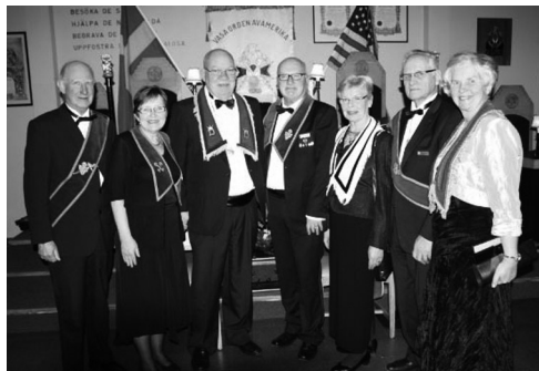
Staben från LL Carl von Linné nr 678.

Vid supén underhölls vi med musik och sång från så skilda länder som Ryssland, Polen, Finland, Argentina och Sverige. Stämningen var hög bland deltagarna och vi skildes åt efter ännu en härlig Vasakväll.