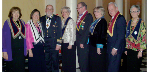
DD med stab från LL Ronneby nr 630.