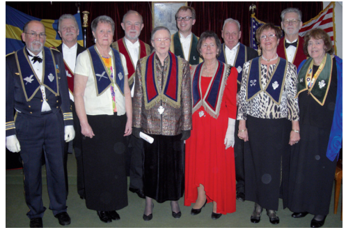
LL630s nya tjänstemän