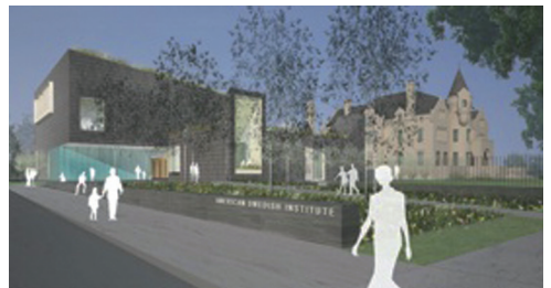
American Swedish Institute's tillbyggnad