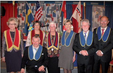
LL628 Ordförande med de tre nya medlemmarna och deras faddrar