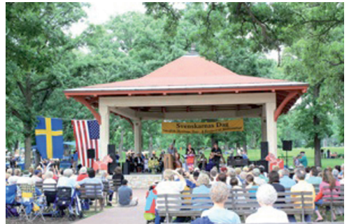
Firandet av Svenskarnas Dag i Minnehaha Park