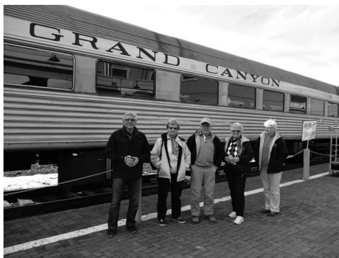
På väg till Grand Canyon