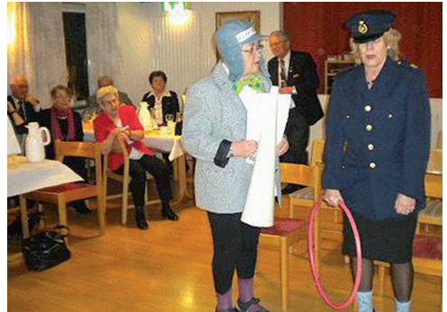
LL634 en busstur till Ullared