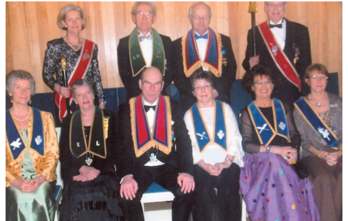
LL 608 Logens nya tjänstemän