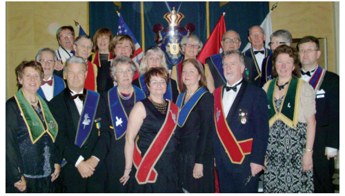
LL 601 Logens nya tjänstemän