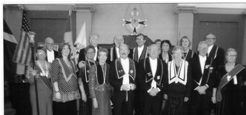
ovan: LL Skånes nya tjänstemän, nedan: ett besök i baren.