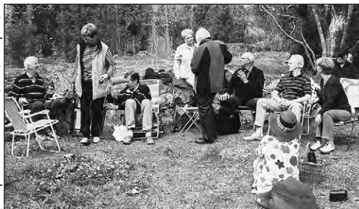
I fjol så var... vi i hagen