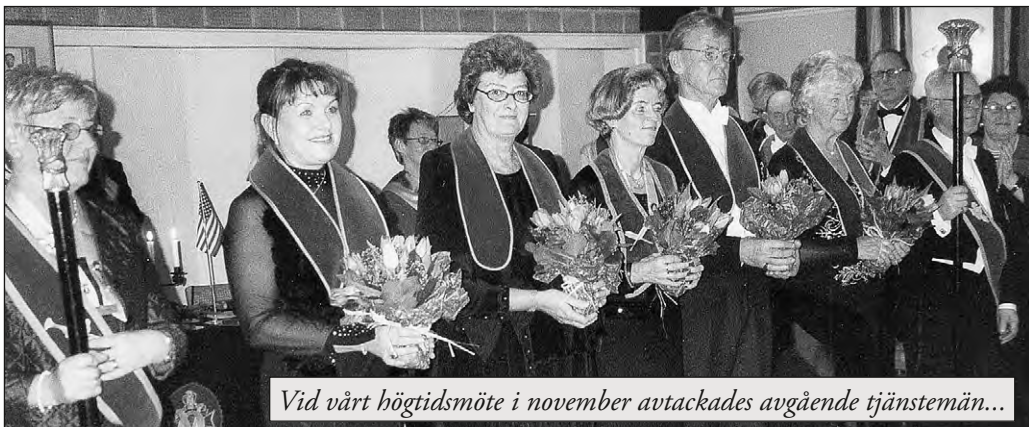
Vid vårt högtidsmöte i november avtackades avgående tjänstemän...