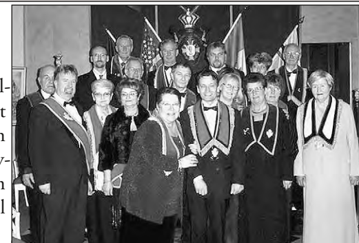
Logens installerade tjänstemän för kommande termin