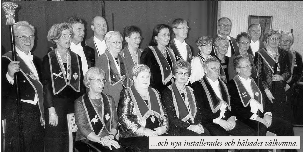
...och nya installerades och hälsades välkomna.