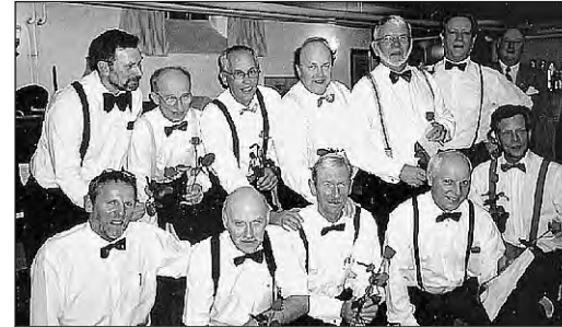
Kabaregänget vid brödernas afton.

Lördagen den 28 februari var det dags för nästa Logemöte. Nu fick de nyvalda tjänstemännen känna på sina funktioner. Vid balloting godkändes sju stycken som sökt om medlemskap i vår loge.