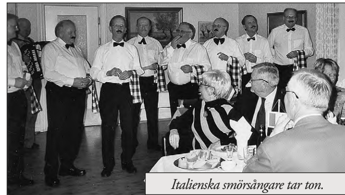
Italienska smörsångare tar ton.

Efterkapitlet, som bröderna i grupp 2 och 9 stod som värdar för, anknöt till Italien och italiensk-amerikansk musik. Borden var dukade i italienska färger och även blommorna gick i vitt, rött och grönt. Bröderna, för dagen förvandlade till italienska kypare och smörsångare, inledde med körsång av "O sole mio", med ny text. I Fratelli ilade mellan borden och såg till att alla kunde njuta av den italienska måltiden.