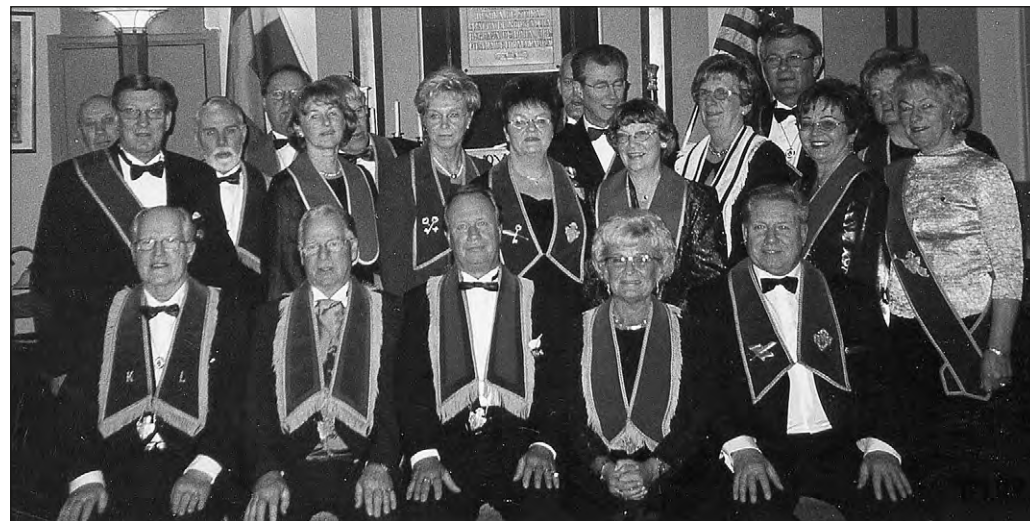
Logens nyvalda tjänstemän.