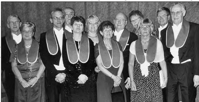
Logens nya medlemmar