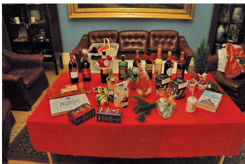
Kvällens vinstbord i varulotteriet.

Logemöte fredagen den 12 januari 2018 . Nytt år och vi fick nöjet att inviga två nya medlemmar i gemenskapen. Det ger oss hopp om framtiden för vår loge! DD Gull-May ledde årsmötesförhandlingarna som avklarades lätt tack vare att alla handlingarna var utskickade före mötet. Därefter