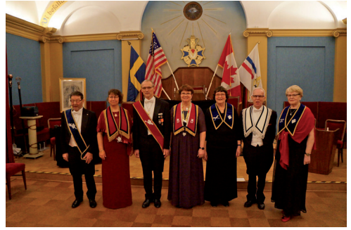
DD Gull-May med Installationsstaben från Logen Tomelilla.

Matsalen stod fint uppdukad och vi serverades Italiensk Serranoskinka med gallia och honungsmelon tomat och