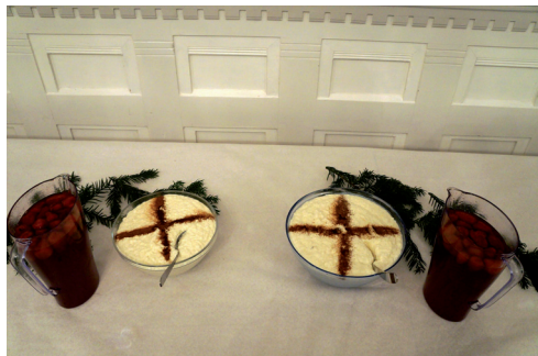
Gröt finns det alltid plats för.