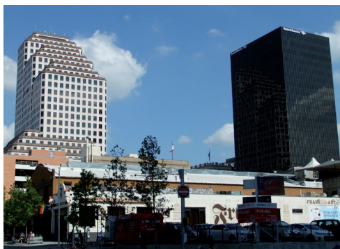
Blandad bebyggelse i centrala Austin, Texas.