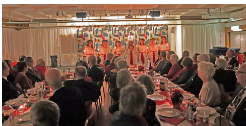
Vi efterkapitlet gjorde Kalmarbygdens lucia med tärnor intåg och underhåll med mycket skönsång.