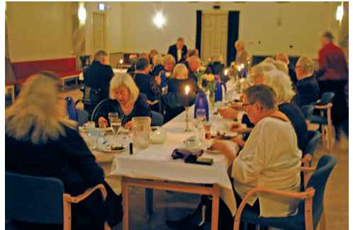
Banketten avnjöts under ljudligt sorl.