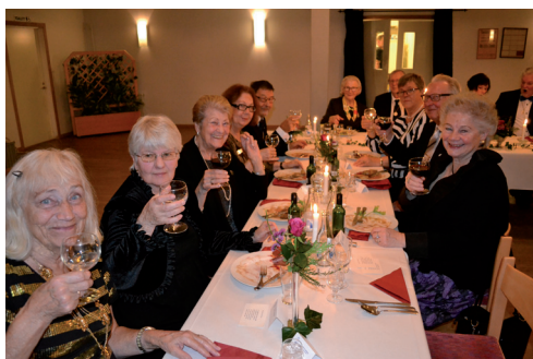
Gäster och egna medlemmar vid banketten.