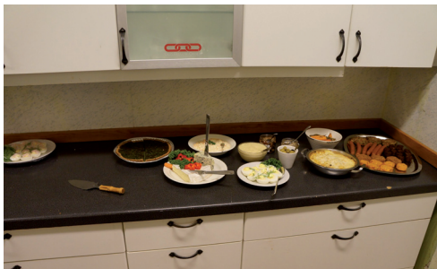
Vegetariskt julbord och där fanns ostbrickan som sedan efterlystes.