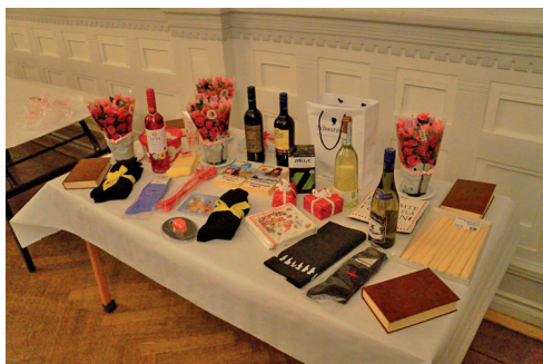
Kvällens lotterivinster väntar på sina vinnare.