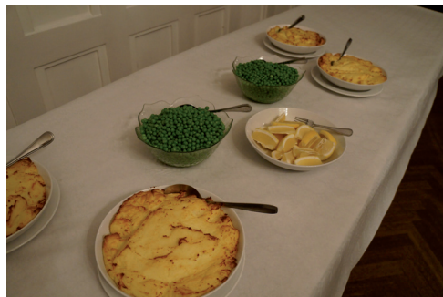
Bergtunga med hummersås och duschesspotatis samt kräftstjärtar.

Matsalen stod fint uppdukad och bordsplaceringen ordnades med vita och svarta stenar. Kvällens meny var Bergtunga med hummersås och duschesspotatis samt kräftstjärtar.