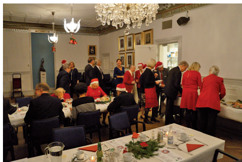
Kö till julbordet.