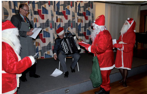
Kall jultallrik och småvarmt avnjöts innan tomtarna rusade in. En trevlig kväll som avslut på höstens loger i juletid.

Tomtar och lotterier avslutade den julinspirerade kvällen./ Marianne