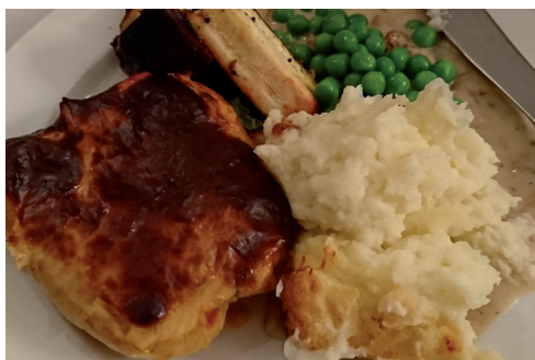
Vegetariskt alternativ som smakade utmärkt.