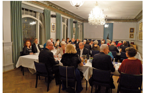
Vj över matsalen med bankett.