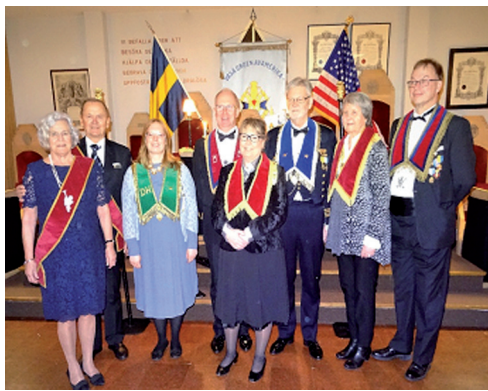
Vasasyskon från Logen Ronneby nr 630: