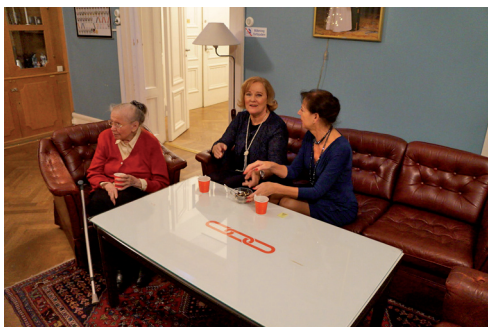
Siri och våra två nyballoterade gäster.