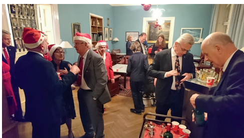
Glögg och pepparkakor.