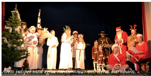
Årets julspej med egna medlemmar och deras barnbarn.

i den ingick alla julens aktörer som Lucia, luciatärnor, pepparkaksgubbar, Tomtemor och Tomtefar, Staffan Stalledräng med en olydig häst, sockerbagare och till slut även Rudolf med den röda mulen och alla åldrar deltog i sagan och sjöng med av hjärtats lust.