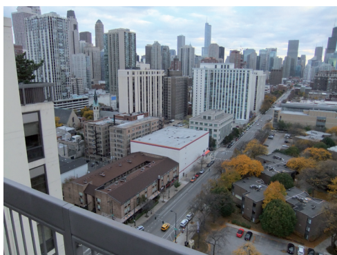
Blandad bebyggelse i centrala Chicago, Illinois.

Foton från Syster Catherines amerikanska reseberättelse. Se även sista sidan!