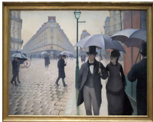
Tavla på Chicago Art Museum Chicago, Illinois.