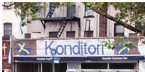
Även i New York kan man hitta ett kondis att fika på!