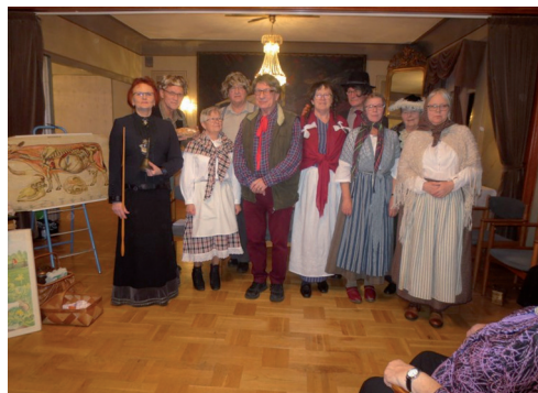
En skolaavslutning anno 1876 i Ruskaby skola.