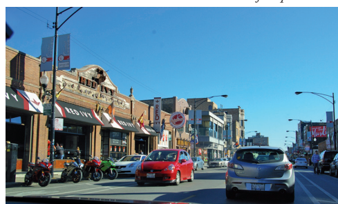
Storgatan i Andersonville, Chicago, Illinois.