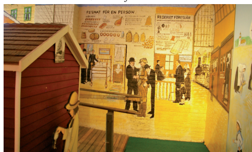
Från utställningen på Swedish Museum, Andersonville, Chic.