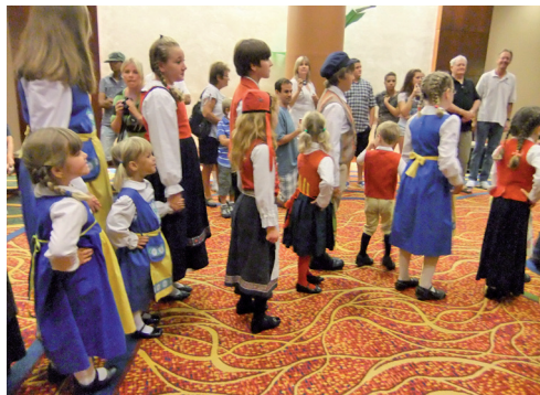
Dansuppväsning av barn- och ungdomsklubben vid Storlogeinvigningen i New York 2010.