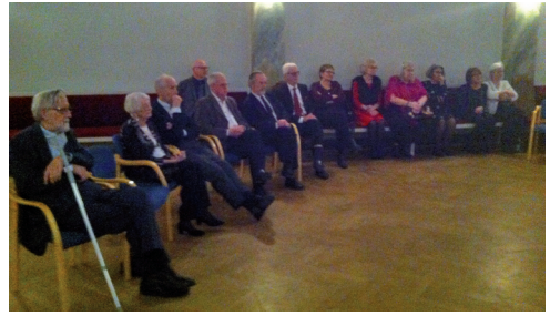
En förväntansfull skara logesyskon hade bänkat sig framför "vita duken".