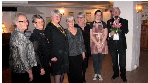
Klubbmästeriet avtackas på januarimötet.