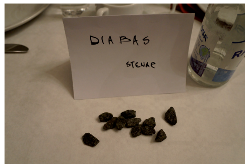
Kreativ bordsplacering med svarta och vita stenar.