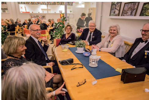
Efterkapitlet med kaffe i Loungen avnjöts i trevlig anda bland nya och tidigare medlemmar.