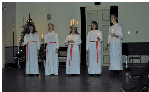
Fem skönsjungande elever från Sankt Sigfrids Folkhögskola förgyllde vår logekväll.