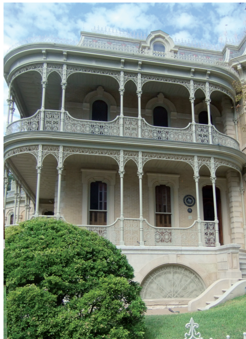
Patriciovilla i Austin, Texas.