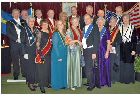
Nyinstallerade tjänstemän för år 2016.