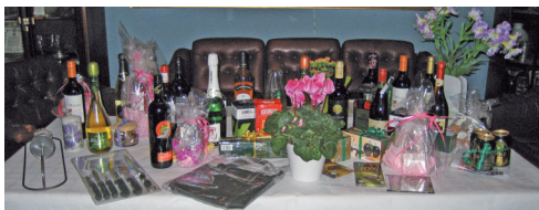
Vinstbordet i Skåne nr 570.