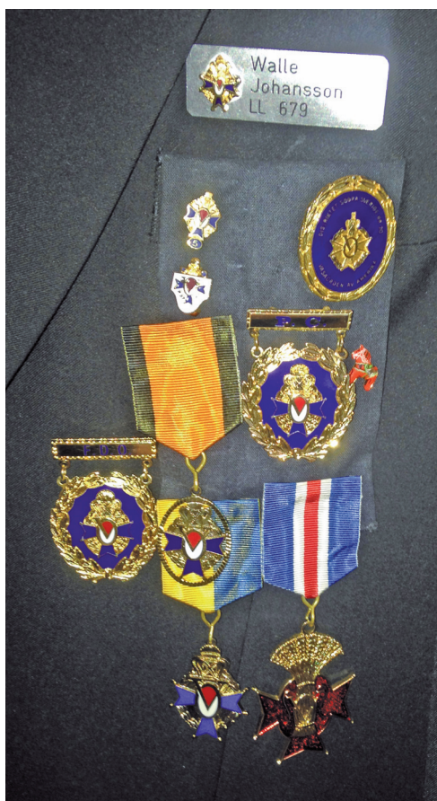
Walles märken och förtjänstecken.