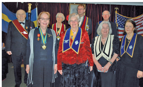
Installationsstaben från Logen Carl von Linné nr 678 Växjö.