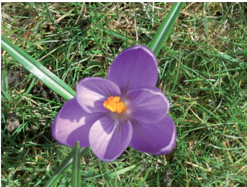
En tidig krokus i gräsmattan.