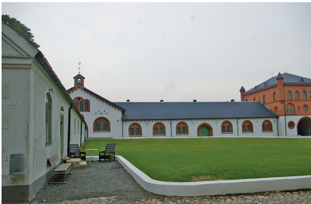
Bollerups gård utanför Tomelilla