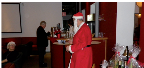
Tomten i all sin glans.

Och plötsligt, alldeles för fort, var även den kvällen slut. Vasasyskonen drog sig hemåt, nöjda med en riktigt trevlig kväll! /Göte S