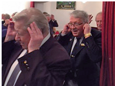
Små grodorna är lustiga att se!

Därefter lämnades Scalapaviljongen och vi tog oss till Ekets Bygdegård där god mat och tomte väntade. Före tomtebesöket dansades det jullekar till dragspelstoner. Samvaron blev god och skönsången ljöd över bygden.