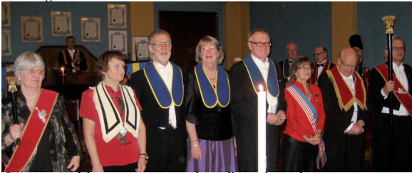
JLL 570. Utdelning av 10-årsmärken till åtta logeskon.