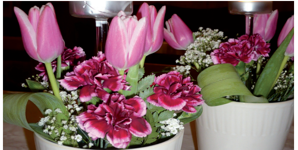
LL 747. Blomsterarrangemang av Helena Jönhill.