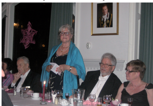
LL 570. DD håller tacktal.