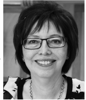
Det stora rådslaget