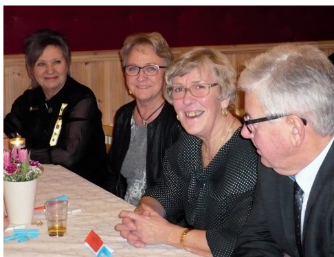
Trevligt vid kaffeborden.