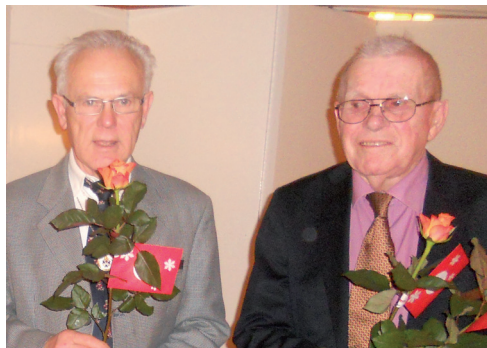
Trogna medlemmar som deltagit i årets alla möten.