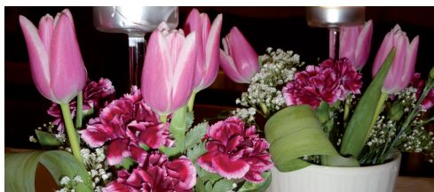
Blomsteruppsatserna hade arrangerats av Helena Jönhill.

Som vanligt blev det kaffe och lottdragning också innan vi begav oss hemåt i vinternatten. /IE