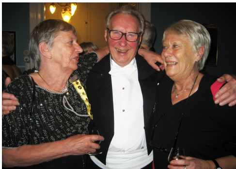
LL 570. Trivsamt på högtids- och installationsmötet.