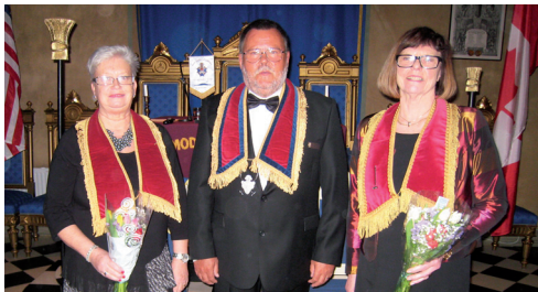
LL 749. FDO, ny O Lars-Erik Karlsson, fd FDO