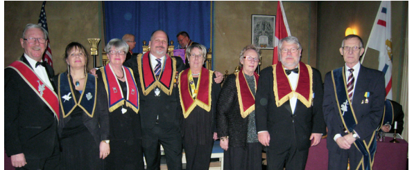
LL 749. Installationsstab från LL Wetsrevik Nr 679.