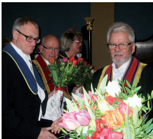
Br O tackade avgående tjänstemän med blommor.