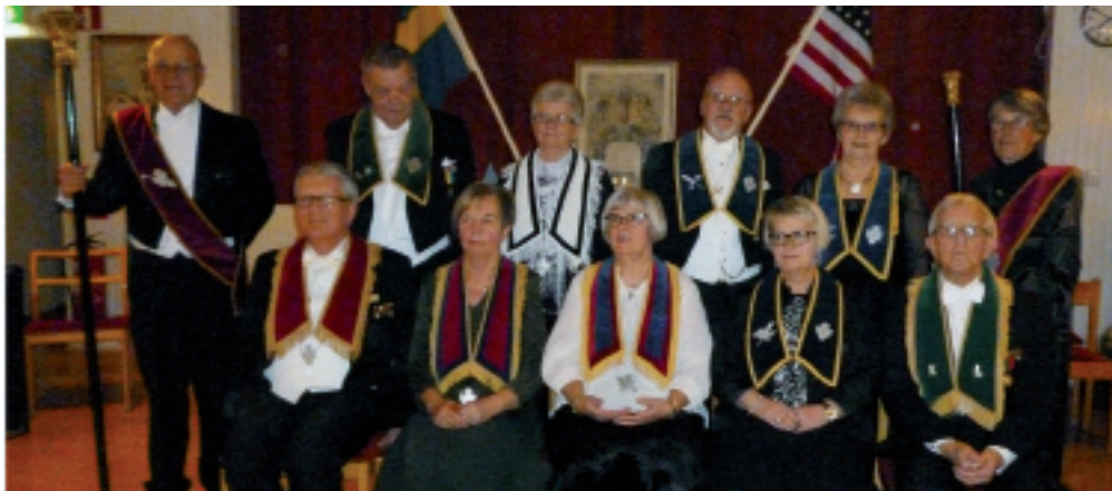
Nyinstallerade tjänstemän för 2015