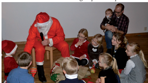
Nedan. Trevsamt och gott vid borden på logens countryafon.