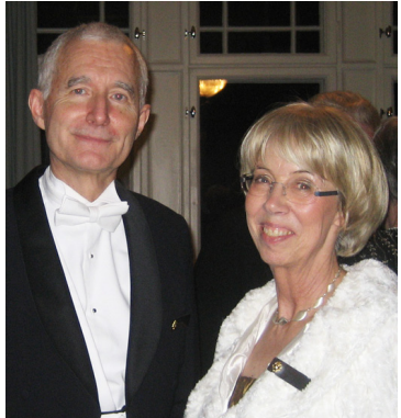
LL 570. Feststämning på logens högtidsmöte.