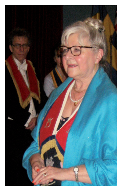
LL 747. DD Gunilla B.