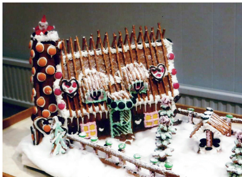
LL 608 Det fantastiska pepparkakshuset lottades ut.