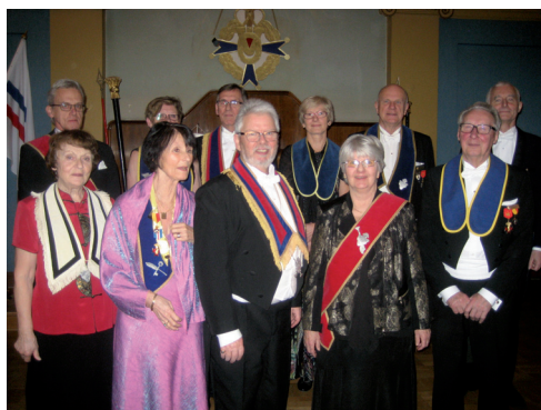
Den nyvalda styrelsen i LL 570.