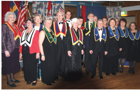
LL 628: nya tjänstemän

Logen hade vid årets slut 122 medlemmar. I genomsnitt besökte 59 medlemmar våra logemöten. Logens ekonomi är god. Årsavgiften förblir oförändrad. Styrelsen beviljades full ansvarsfrihet.