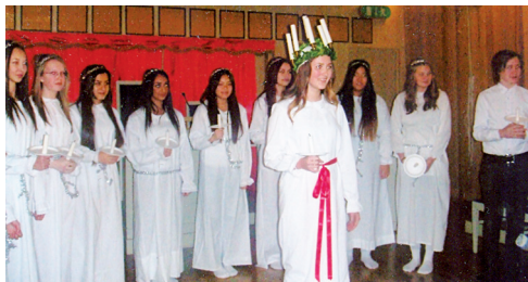
LL608 ovan LL628 nedan