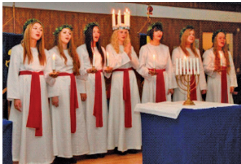
LL631 till höger LL634 nedan t.h.