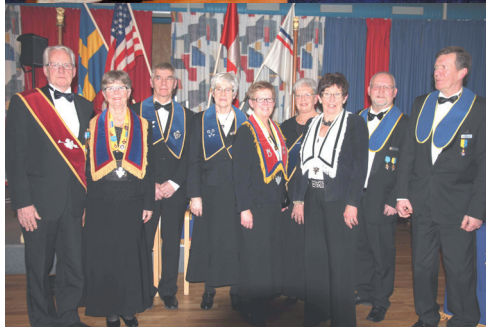
Installationsstaben i LL628, ovan Glöggmingel i LL628, nedan