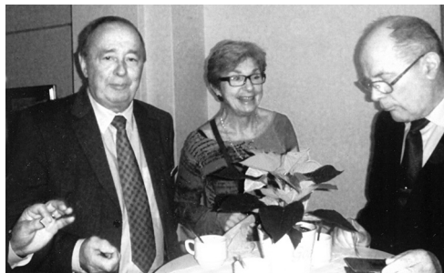
Julmötet i Logen Kärnan: I väntan på lucia.

Efter ett digert julletteri, var det dags att avtacka arbetsgruppen och vi önskade varandra En God Jul och Ett Gott Nytt År.