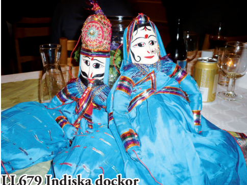
LL679 Indiska dockor