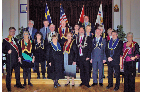
ovan LL679s tjänstemän nedan LL747s tjänstemän