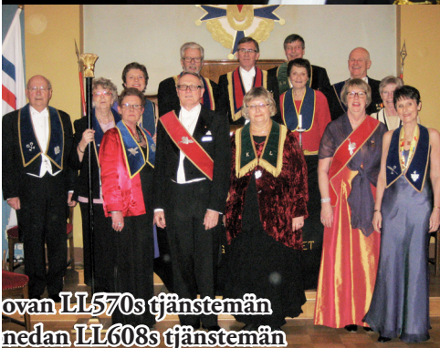
ovan LL570s tjänstemän nedan LL608s tjänstemän