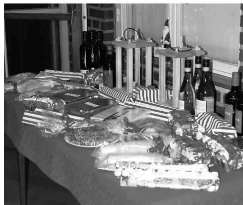
Det fina lotteribordet.