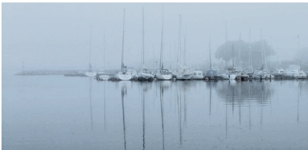
En disig morgon i Borgholms hamn, Öland.