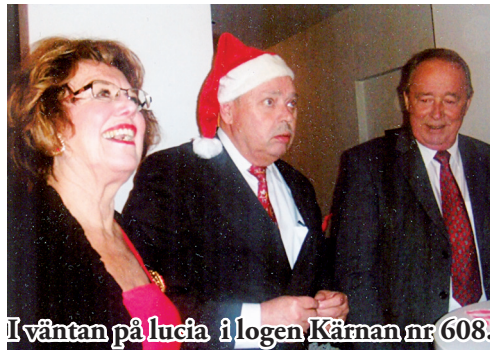
I väntan på lucia i logen Kärnan nr 608.