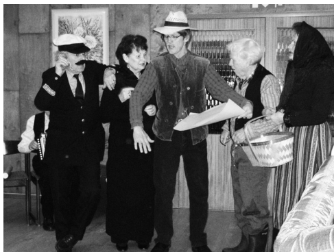
Vasaaktörerna spelar upp en scen om enskiftet vid efterkapitlet.

”På sitt gods Svaneholm hade Rutger Maclean genomfört ett framgångsrikt skifte efter Engelskt mönster. Kungen hade sneglat på detta och funnet det intressant varför man kungjorde en förordning om enskifte i Skåne 1803. Meningen var att man skulle sammanföra de spridda markerna till separata gårdar vilket i sin tur betydde att gårdarna fick utlokaliseras från byn till nya platser, en förändring utan motstycke”.