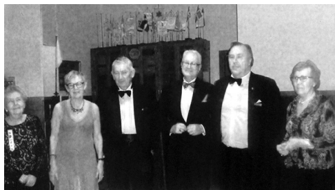
Del av arbetsgruppen som ordnat så fint vid installationsmötet den 9/2 med logen Kärnan.