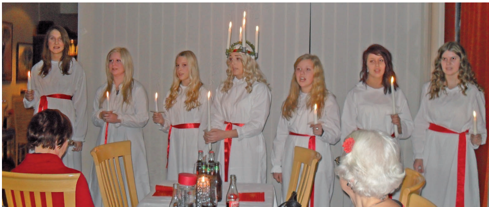
Luciauppvakningen i LL Utvandrarerna nr 680.