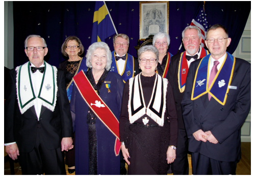
Installationsstaben i LL678 kom från Calmare Nyckel.