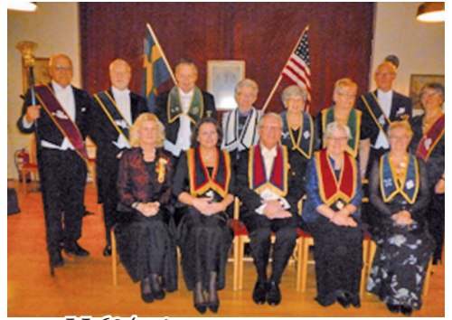
ovan LL634s tjänstemän nedan LL678s tjänstemän