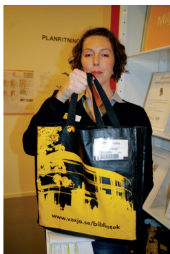
Bibliotekarien på Växjö stadsbibliotek visar upp en färdig bokbag.

Glöm inte bort att anmäla dig till Distriktsmötet i maj!