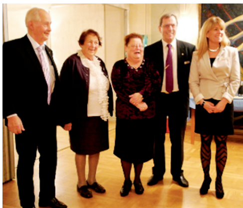
Ytterligare gäster kom till efterkapitlet.