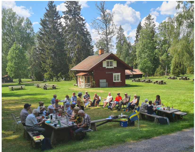
Logen Bråvikens medlemmar njuter av solen och Nationaldagen vid Sörsjöns camping.

Därefter blev det rättande av tipspromenaden och prisutdelning. Bra kämpat alle-