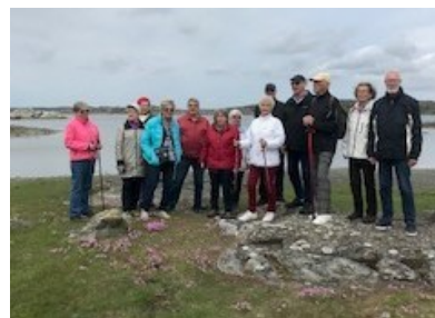
Logen Kongahällas medlemmar i Tofta naturreservat.