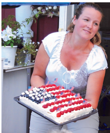
Den "berömda" amerikatårten