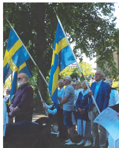
En del av fanborgen med Logen Knallens fana längst till höger framför några Vasasyskon

Ett 30-tal Vasasyskon slöt upp vid nationaldagsfirandet i Borås Stadspark. Vi fick lyssna till musik av Hemvärnets Musikkår, sång av två solister och sex barnkörer och ett högtidstal av universitetslektor